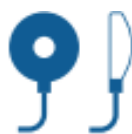
ENTRY LEVEL ELECTRODES